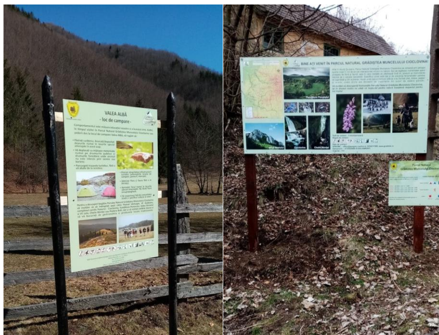
Panouri informative amplasate în arealul parcului

Personalul APNGMC a monitorizat în permanență activitatea turistică în aria protejată și a oferit informații relevante vizitatorilor.