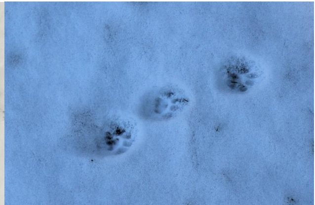
Urme de pisică sălbatică

S-au stabilit cinci transecte de monitorizare pe cursurile apelor Strei, Anineș, Bănița și Crivadia pentru specia Lutra lutra (vidră). Până în momentul de față au fost indentificate șase exemplare de vidră, prin intermediul urmelor.