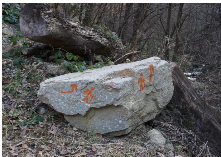
Marcaje turistice reîmprospătate

Personalul APNGMC a monitorizat în permanență activitatea turistică în aria protejată și a oferit informații relevante vizitatorilor.