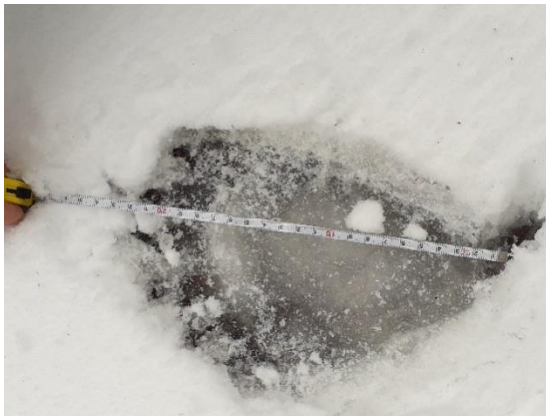
Urmă de urs

În cadrul acțiunilor de monitorizare, au fost folosite metoda transectelor și camere de monitorizare. Monitorizarea carnivorelor mari s-a dovedit foarte eficientă, fiind înregistrate numeroase semnalări ale speciilor vizate (urs, lup, râs, pisică sălbatică).