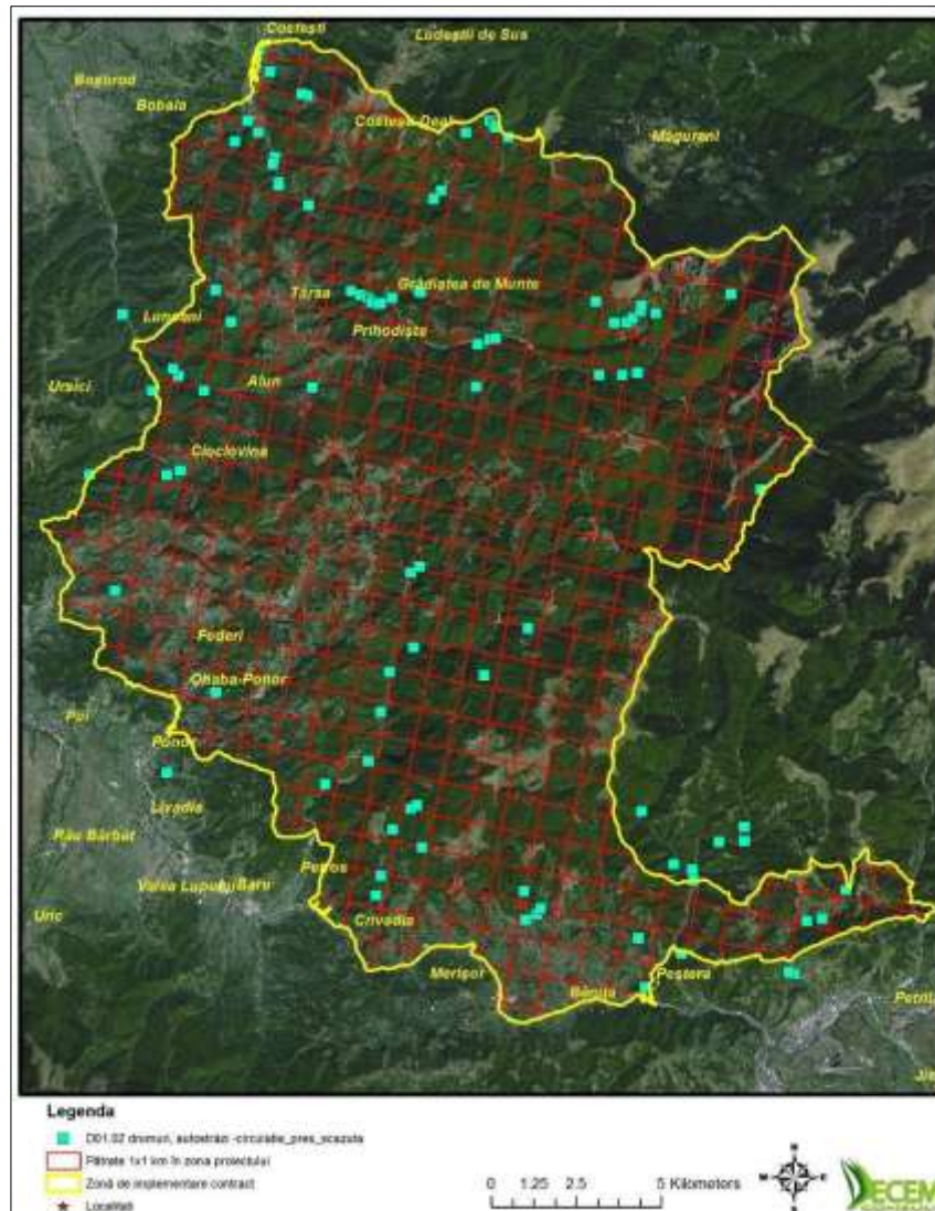
Figura 1. Localizarea zonelor în care trebuie implementată măsura privind menținerea permeabilității habitatelor la urs, râs, jder, lup și pisică sălbatică

M20. Control în vederea prevenirii și combaterii transportului materialului lemnos prin albie și afectării malurilor și a vegetației de pe maluri.