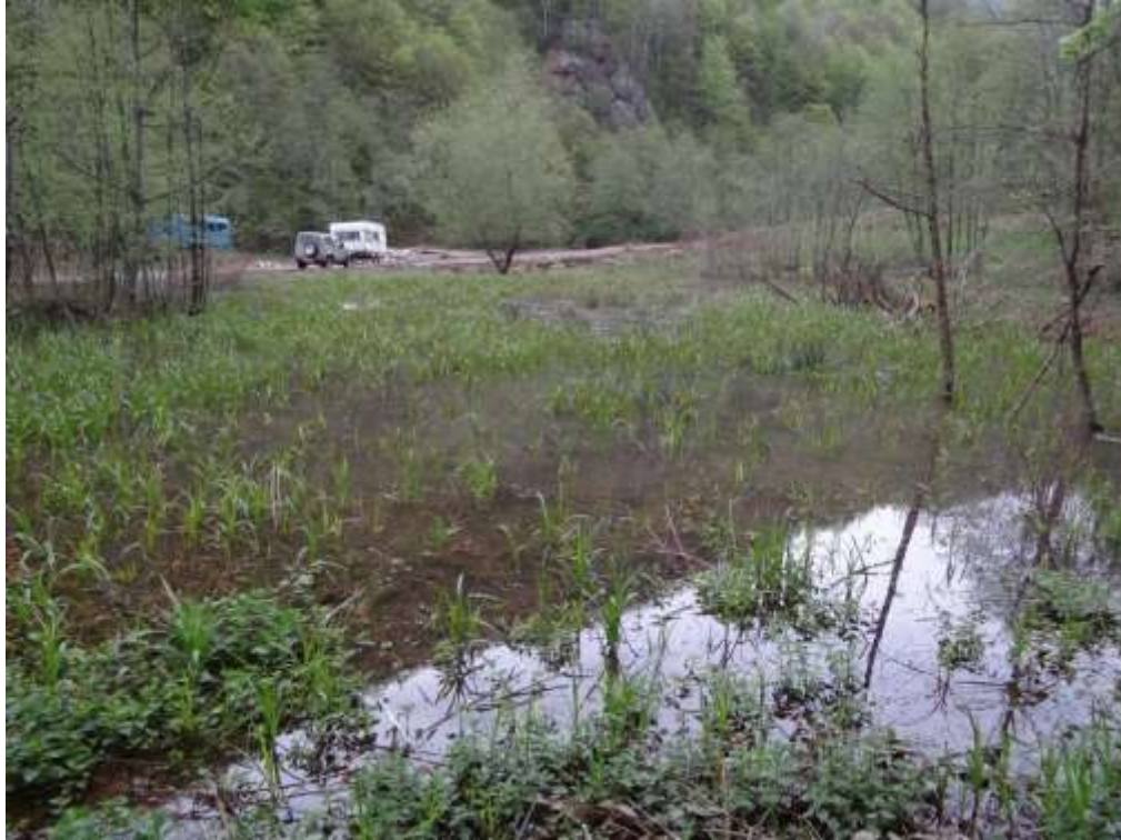
Figura 1a. Habitat amfibieni pe care este necesară implementarea măsurilor specifice