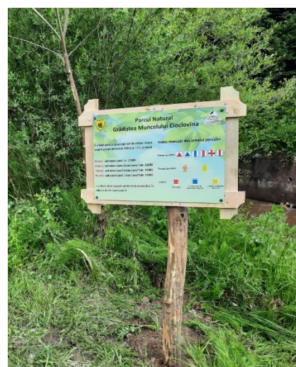
Panouri informative amplasate în arealul parcului

Personalul APNGMC a monitorizat în permanență activitatea turistică în aria protejată și a oferit informații relevante vizitatorilor.