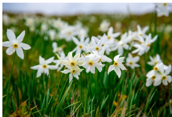
Narcissus poeticus ssp. radiiflorus

Monitorizarea carnivorelor mari s-a dovedit foarte eficientă, fiind înregistrate numeroase semnalări ale speciilor vizate (urs, lup, râs, pisică sălbatică). De asemenea, s-a realizat monitorizarea speciei Lutra lutra (vidra) pe cursurile principale de apă ale parcului.