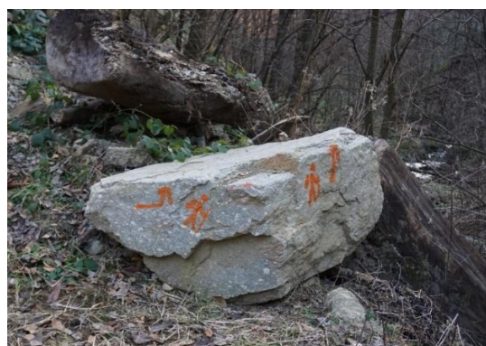
Marcaje turistice reîmprospătate

De asemenea, în arealul parcului au fost amplasate noi panouri informative pentru completarea infrastructurii turistice.