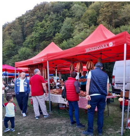
Sărbătoarea Crescătorilor de Ovine „Țurcana - Regina Munților”