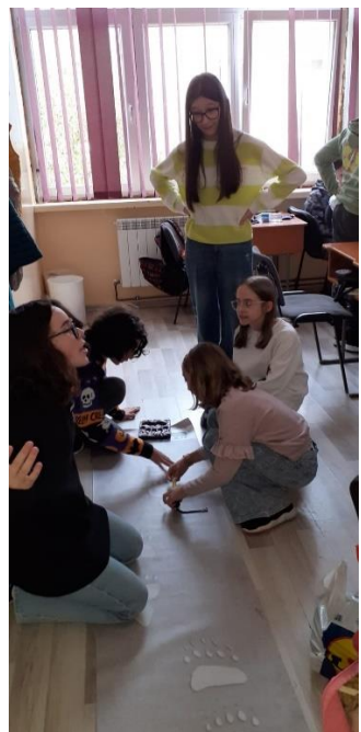
Activități de educație ecologică