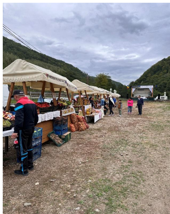
Ateliere de meșteșugari și târg cu produse locale