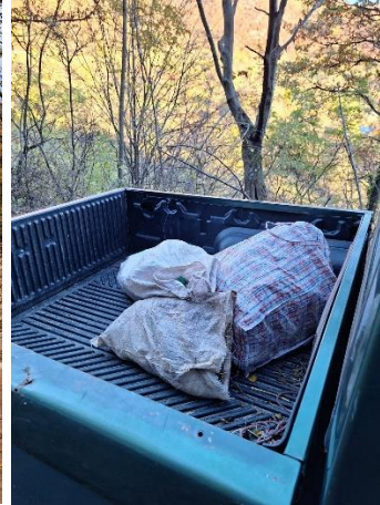
Activități de igienizare/ecologizare

Personalul de teren al APNGM-C a monitorizat în permanență activitatea turistică în aria protejată și a oferit informații relevante vizitatorilor.