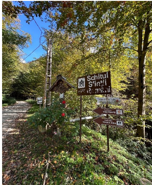
Lucrări de întreținere a infrastructurii turistice