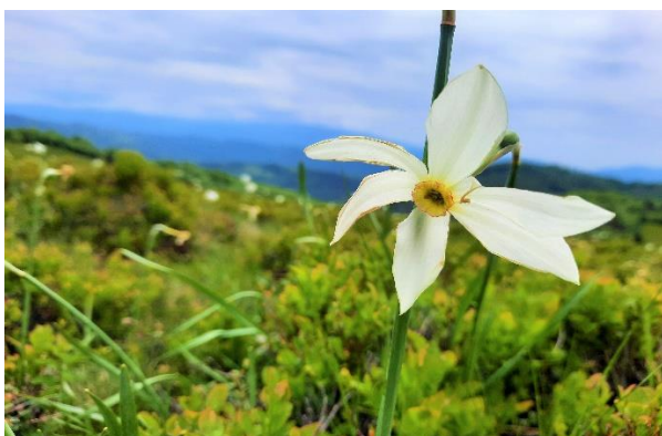
Narcisă ( Narcissus poeticus subsp. radiiflorus )

În ceea ce privește sursele de poluare din zonele Valea Streiului, Valea Luncanilor, Târșa și Prihodiște, acestea au fost ținute sub observație, iar vestea bună este că nu s-a observat o creștere a poluării datorată abandonării de gunoi menajer în aceste zone.