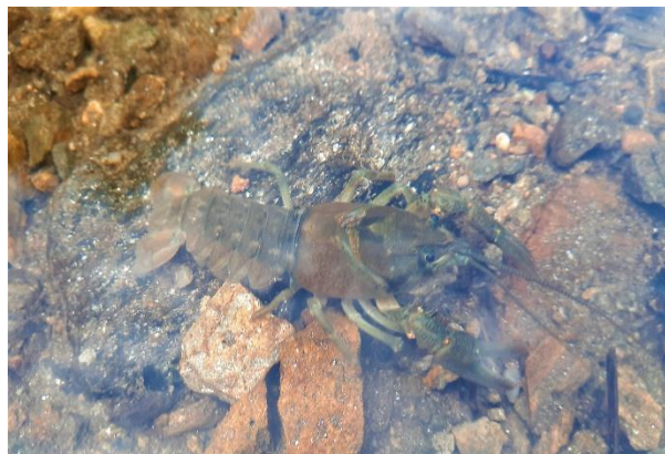
Racul de ponoare (Austropotamobius torrentium)