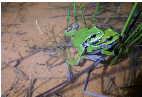
Brotăcel (Hyla arborea)