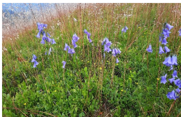
Clopoței ( Campanula serrata )