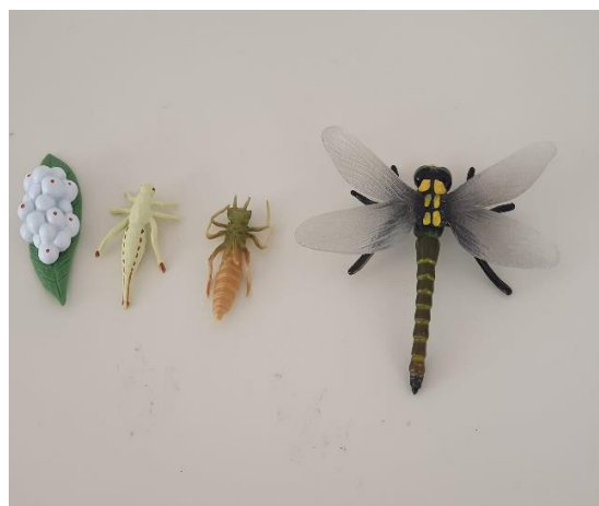
Activități de educație ecologică la Liceul Tehnologic Energetic Deva