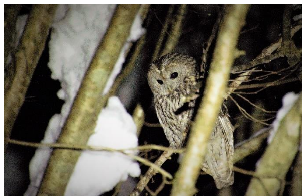
Huhurez mic (Strix aluco)