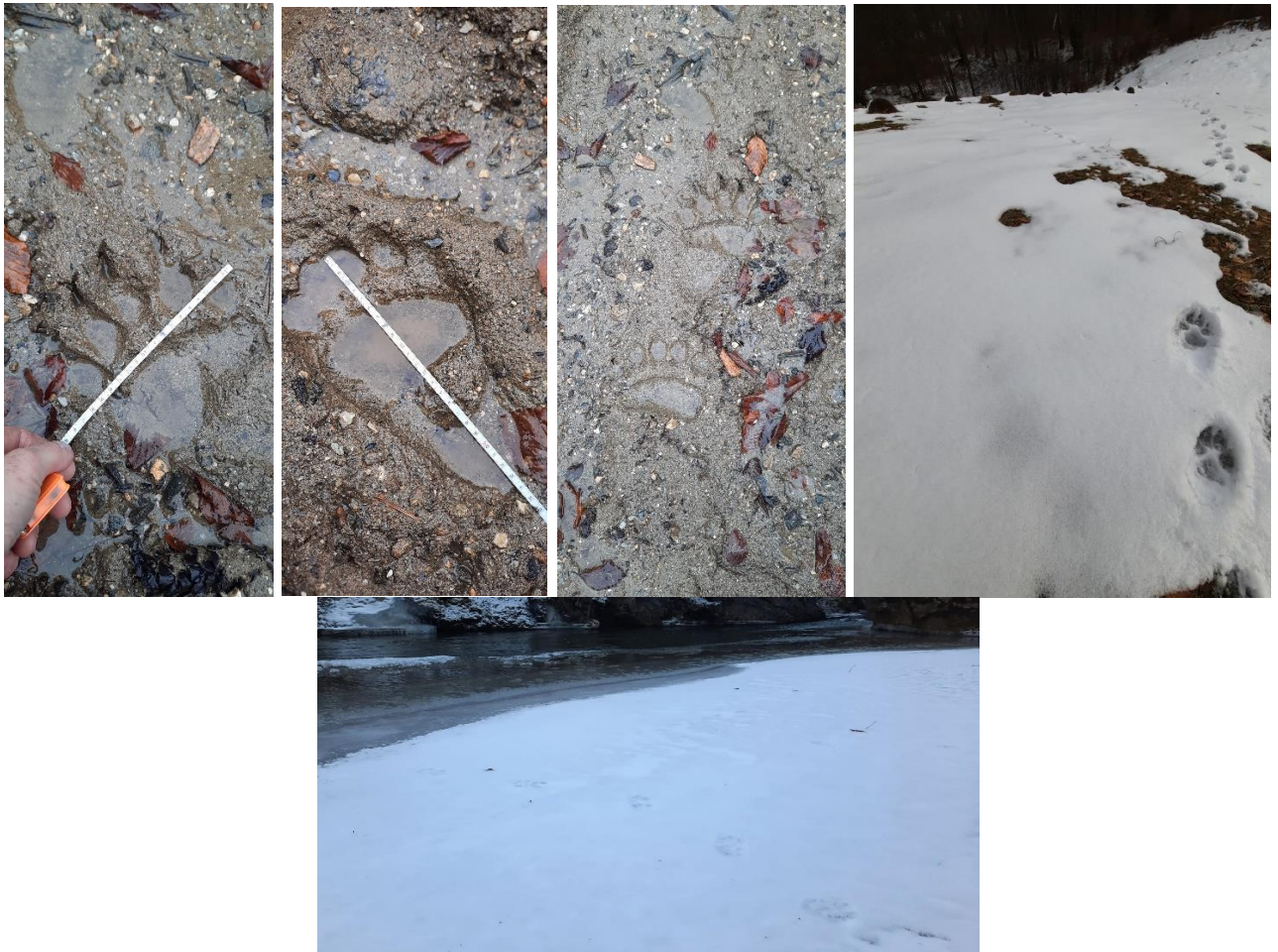
Monitorizare carnivore mari și vidră ( Lutra lutra )

În cursul primului trimestru al anului 2024 s-a finalizat monitorizarea carnivorelor mari și a fost realizată monitorizarea următoarelor specii de lilieci: Miniopterus schreibersii , Myotis myotis , Myotis blythii , Pipistrellus pipistrellus , Rhinolophus ferrumequinum și Rhinolophus hipposideros . De asemenea, în acest trimestru a început monitorizarea vidrei ( Lutra lutra ), care va fi finalizată în luna aprilie.