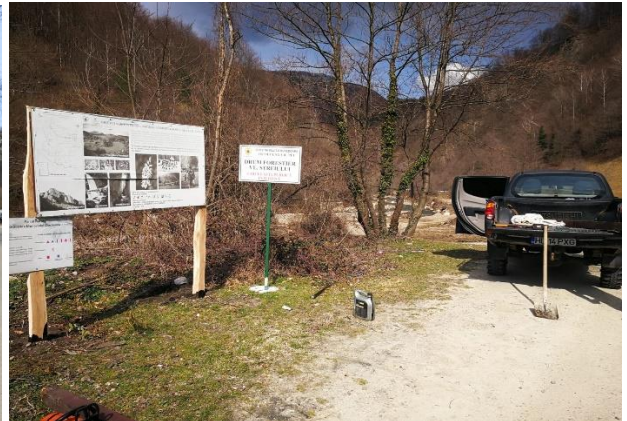
Lucrări de întreținere a infrastructurii turistice