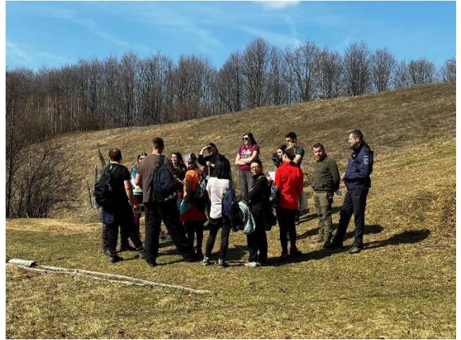
Activități de informare și conștientizare a turiștilor