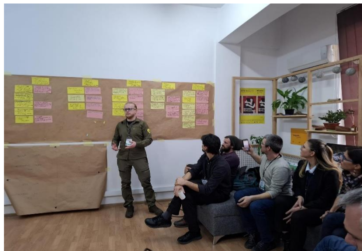
„Urban Lab: Restaurarea biodiversității în Valea Jiului”

Pe 17 martie 2025, la Reșița, a avut loc o întâlnire în cadrul proiectului „Peisajul din Carpații de Sud-Vest. Menținerea celei mai întinse sălbăticii din Europa – pentru bunăstarea comunităților” (ELSP), dedicată dezvoltării comunitare. Evenimentul a reunit autorități locale, membri ai comunității și specialiști în protecția mediului, cu scopul de a discuta și propune soluții durabile pentru armonizarea dezvoltării economice cu conservarea biodiversității în această regiune montană.