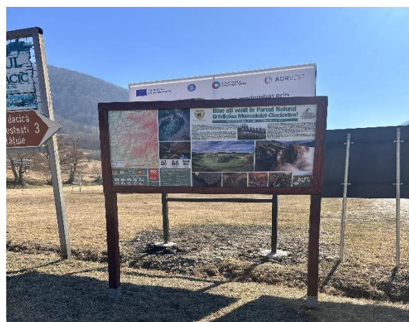
Lucrări de întreținere a infrastructurii turistice