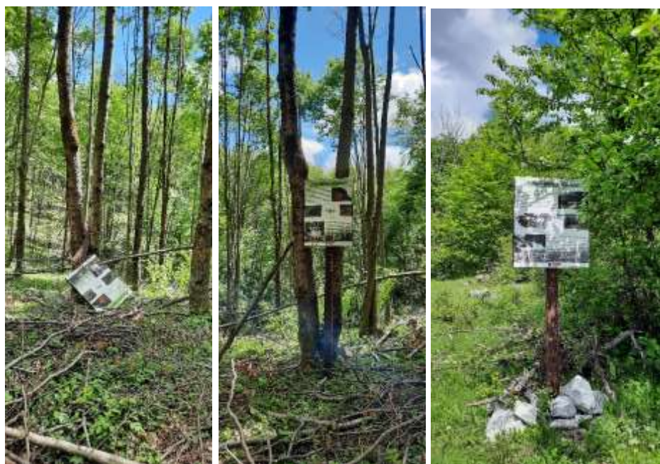
Lucrări de întreținere a infrastructurii turistice

În cursul celui de-al doilea trimestru al anului 2024 personalul administrației parcului a efectuat deplasări pe traseele turistice și tematice de pe teritoriul PNGM-C, în scopul verificării accesibilității acestora, stării marcajelor și panourilor informative, cât și la locul de campare de la Valea Albă și la punctul de belvedere de la Prihodiște, fiind desfășurate activități de mentenanță ale infrastructurii turistice (reîmprospătarea unor marcaje turistice, igienizare/ecologizare și repararea unor panouri informative).