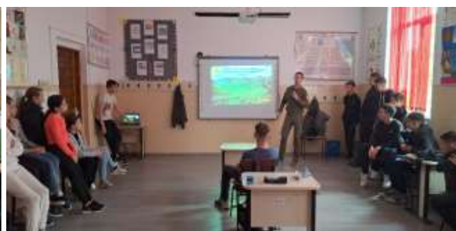
Prezentare concurs preselecție tabără ” Junior Ranger”