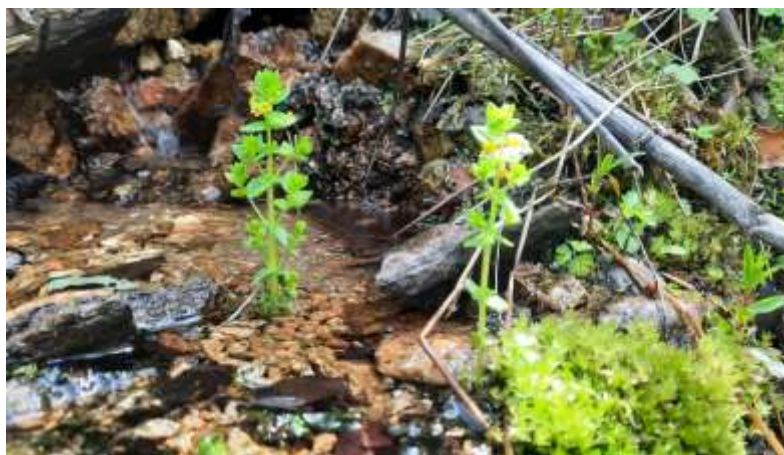
Iarba gâtului ( Tozzia carpathica )