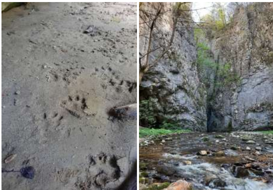
Urme de vidră ( Lutra Lutra ) pe transecte și habitat ( Cheile Crivadiei )

În trimestrul II al anului 2024, am realizat și finalizat monitorizarea unor specii importante și rare de pe teritoriul parcului. Astfel, în această perioadă au fost monitorizate vidra ( Lutra lutra ), iarba gâtului ( Tozzia carpathica ) și narcisele ( Narcissus poeticus subsp. radiiflorus ) din zona vârfului Jigoru Mare.