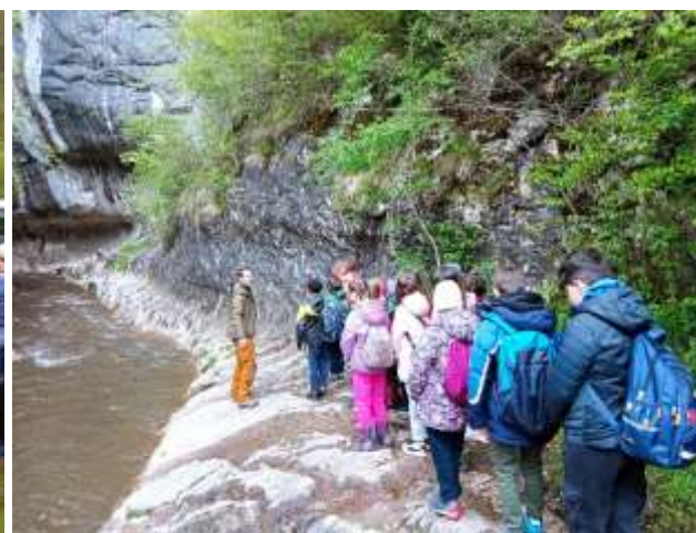
Activități de educație ecologică în cadrul programului "Săptămâna verde"

Ziua Europeană a Parcurilor s-a desfășurat în perioada 22 - 24.05.2024 în județul Vâlcea, fiind marcată printr-o serie de evenimente organizate de către Regia Națională a Pădurilor – Romsilva și Administrația Parcului Național Cozia. În cadrul acestui eveniment administrațiile parcurilor naționale și naturale au fost prezente cu standuri de promovare a valorilor naturale și nu în ultimul rând a comunităților locale, precum și a produselor culinare tradiționale specifice fiecărui parc național și natural din România. Standul Parcului Natural Grădiștea Muncelului – Cioclovina a fost un punct de interes în cadrul evenimentului, mulțumită colegilor noștri care au oferit atât materiale informative vizitatorilor, cât și produse locale specifice comunităților din zona parcului natural.