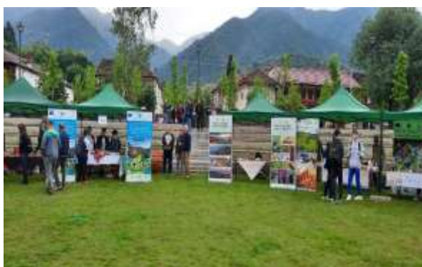
Ziua Europeană a Parcurilor - ediția 2024 -

În perioada 29 – 30.05.2024 a fost lansat concursul de selecție a elevilor din clasele V – VIII, ce aparțin școlilor gimnaziale Baru, Bănița, Boșorod, Orăștioara de Sus și Pui, în urma căruia câte trei elevi de la fiecare școală vor participa în tabăra "Junior Ranger" din perioada (8 -12.07.2024), organizată de către Asociația de Turism Retezat în parteneriat cu Administrația Parcului Natural Grădiștea Muncelului – Cioclovina, în cadrul proiectului "Ecoturismul în Parcul Natural Grădiștea Muncelului – Cioclovina, dezvoltare pentru comunitățile locale", finanțat de MOL România și Fundația pentru Parteneriat Miercurea – Ciuc, prin Programul Spații verzi.