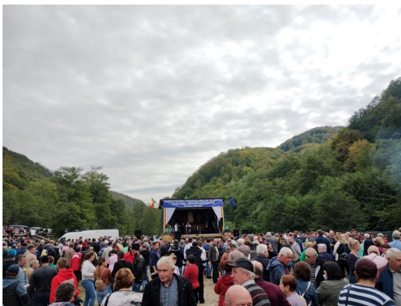
Sărbătoarea Crescătorilor de Ovine "Țurcana - Regina Munților", ediția a XVII-a