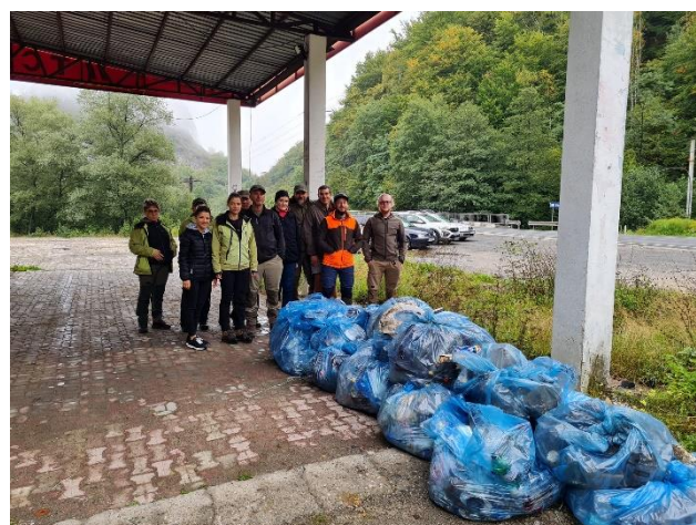
Ziua de Curățenie Națională – „Let's Do it, România!”