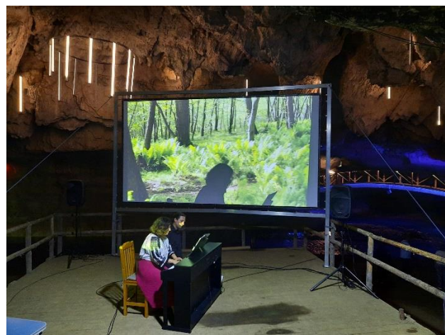
Ziua Parcului Natural Grădiștea Muncelului Cioclovina

În data de 17.09.2022, cu ocazia Zilei de Curățenie Națională, în cadrul programului „Let's Do it, România!”, la convocarea Primăria Comunei Bănița, echipa administrației parcului a participat la acțiunea de curățenie și strângere a gunoaielor în zona obiectivului turistic Cheile Băniței și a căii de acces spre acesta.