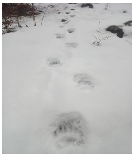
Urmă urs ( Ursus arctos )