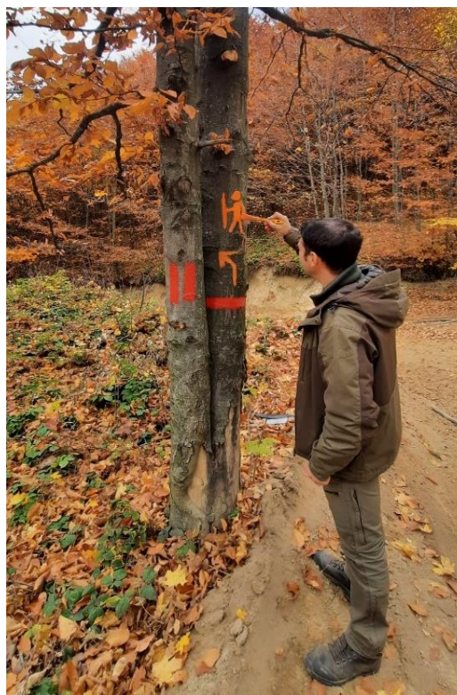
Lucrări de întreținere a infrastructurii turistice

Personalul APNGM-C a monitorizat în permanență activitatea turistică în aria protejată și a oferit informații relevante vizitatorilor